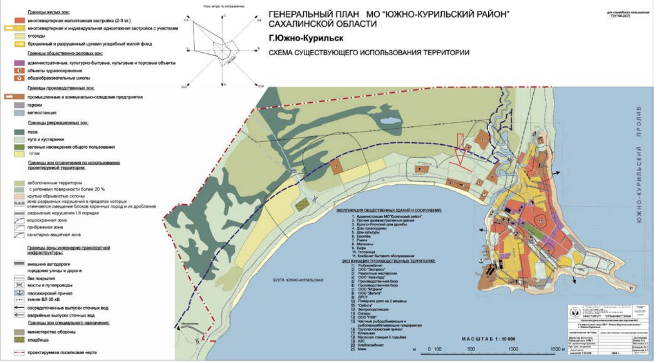
СХЕМА СУЩЕСТВУЮЩЕГО ИСПОЛЬЗОВАНИЯ ТЕРРИТОРИИ